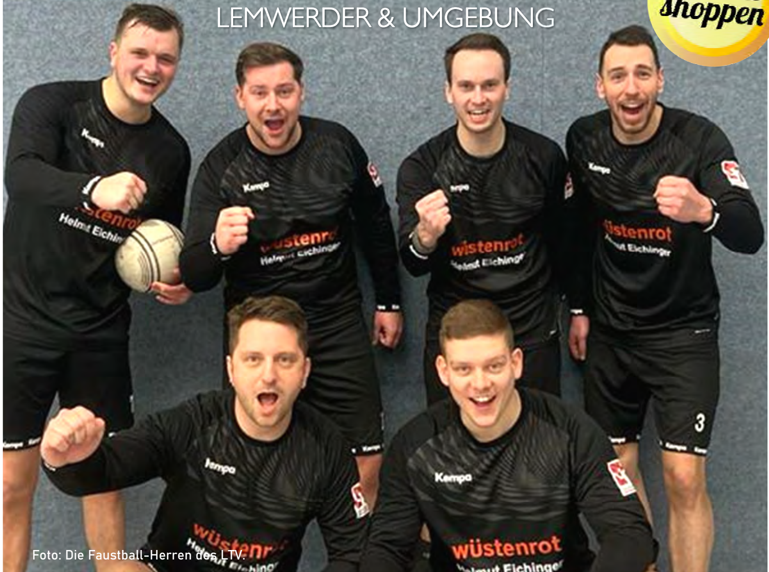
Foto: Die Faustball-Herren des LTV.