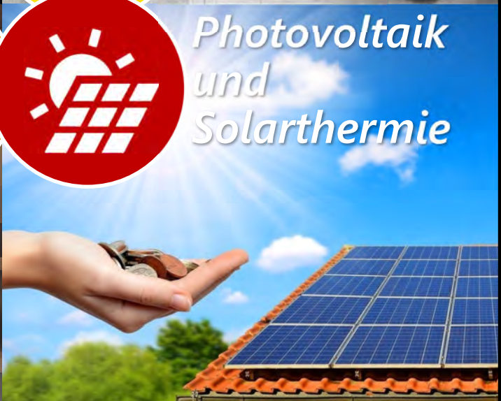
Photovoltaik und Solarthermie